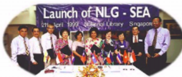
10 Directors member

Brunei Darussalam, Cambodia, Indonesia, Laos, Malaysia, Myanmar, the Philippines, Singapore, Thailand, and Vietnam.